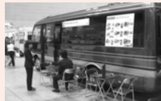
バスをブースに見立てて商談をする出展者