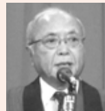
新町光示JATA会長 は「日本と海外の旅行業界が連携し、旅行需要の拡大を実現しましょう」と挨拶