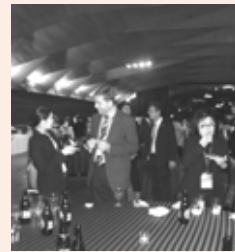
和やかに歓談する参加者たち