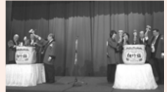
主催者・来賓によるオープニングの鏡開き