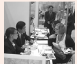
商談が行われる各ブースの様子